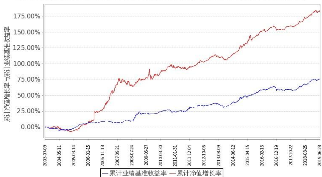
图：嘉实债券份额累计净值增长率与同期业绩比较基准收益率的历史走势对比图