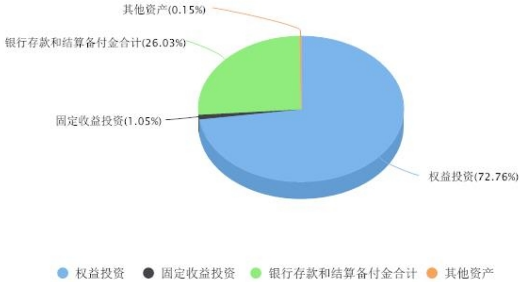
投资组合资产配置图表 数据截止日期:2024年06月30日