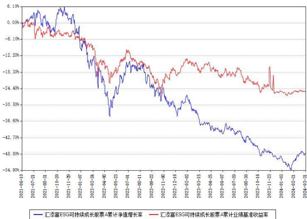
汇添富 ESG 可持续成长股票 A 累计净值增长率与同期业绩比较基准收益率对比图