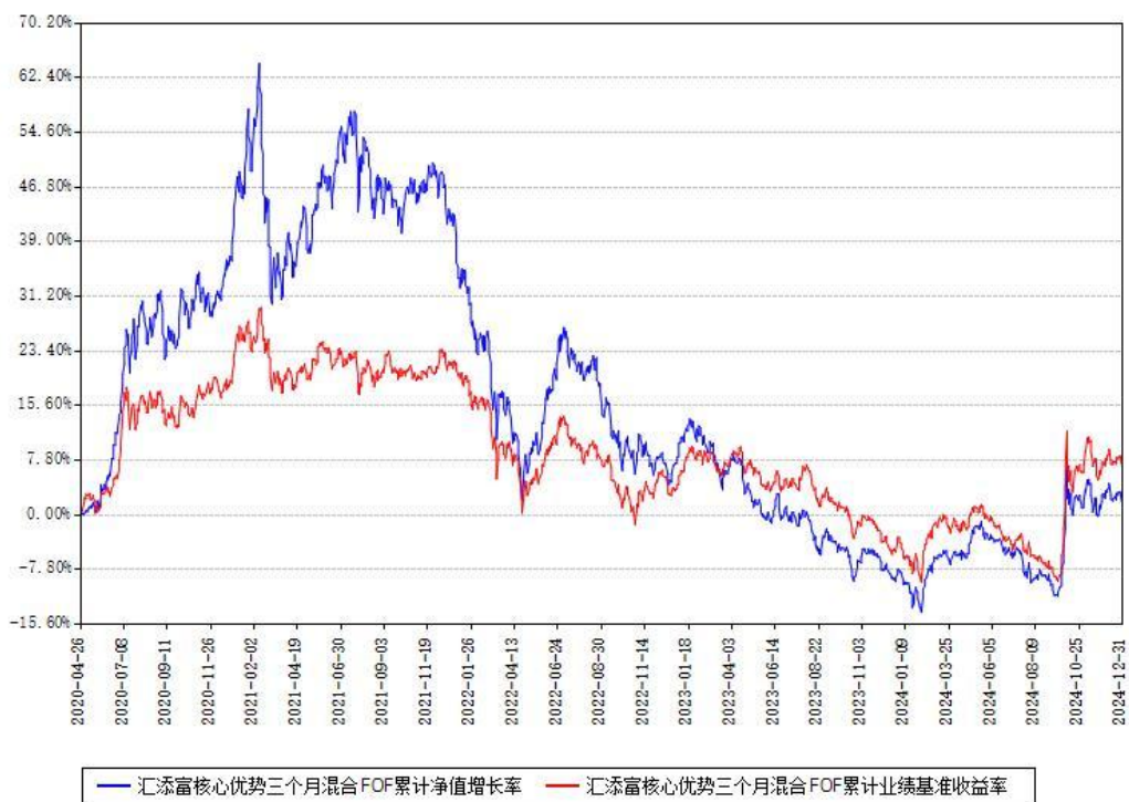
汇添富核心优势三个月混合FOF累计净值增长率与同期业绩基准收益率对比图